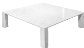
marmo bianco Carrara - white Carrara marble