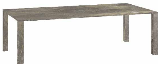
marmo grigio Roma - grey Rome marble

Giulio Cappellini drew from magnificent white Carrara marble and grey Rome marble for the Vendôme collection, which includes a range of dining tables with rectangular or square tops. The slender top rests atop four slightly thicker legs: these proportions give the table a light yet solid appearance. Elegant and sophisticated, in 2021 the Vendôme tables have expanded to include two new alternatives: a large rectangular table and a low-lying square side table.